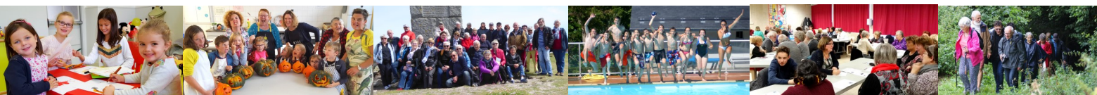
Atelier parents - enfants